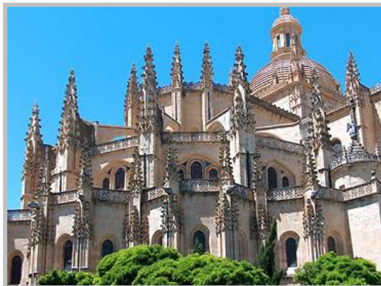
Catedral de Palència