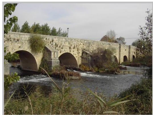
Villamuriel de Cerrato