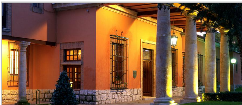
Parador de Tordesillas