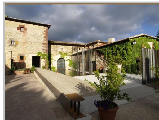
Convent de Mave