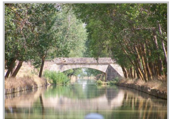
Canal de Castilla (Herrera de Pisuerga)