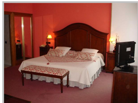
Hotel Rey Sancho 4* (Palència)