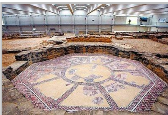
Mosaic de la Vila Romana d'Olmeda