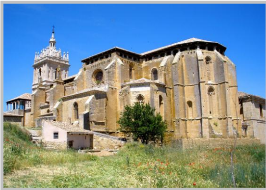
San Hipólito de Tamara